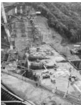
コンクリート打設が進められているダム本体

約5千3百億円の工費をかけ、東京オリンピック・パラリンピック開催年である2020年の完成を目指している。大量のコンクリートが必要になるため、採石場とダム工事現場をつなぐベルトコンベアの長さは10kmにもおよび、国家プロジェクトとして進む工事の規模に、参加者は終始圧倒されていた。