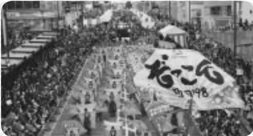
原町田大通りを埋めつくす来場者