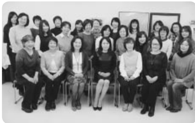
お話を伺った刈川会長(写真前列中央)と従業員の皆さん

パソコン教室では、趣味系講座や資格対策講座等、幅広い年齢層の方が学べる環境が整っていると思うので、ぜひ一度足を運んでほしいと思います。