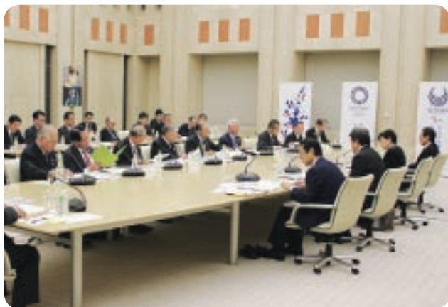
都内8所の会頭が揃い、小池都知事と懇談

冒頭に主催者を代表して、三村会頭（東京）より、小規模事業者の現況と課題等を説明した上で、東京都における産業振興策への期待や多摩地域の活性化策の支援などを述べた。