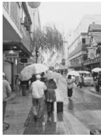
雨の中、元町の商店街を歩く参加者

商店街づくりにつながっていることがわかった。質疑応答も相次ぎ、参加者の満足度が高い内容となった。