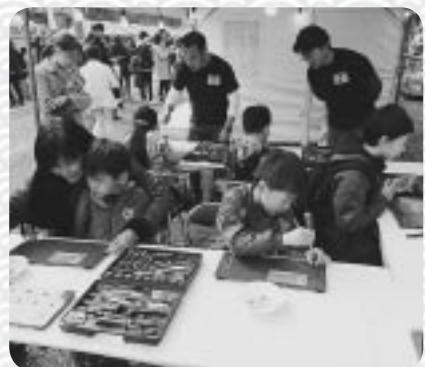
子供達で盛況だったものづくり体験コーナー