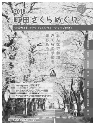
『さくらめぐり公式ガイドブック』町田ツーリストギャラリーで配布中