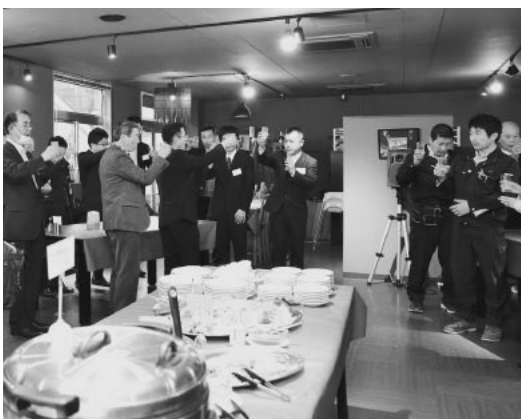
両者の交流の場となったペダラーダ

一方で、連携にあたっては「農作物の規格・量の確保が難しい」「新たな品種の作付けは避けたい」といった農家側の意見も伝えられた。その背景には農家の高齢化、農地・後継者・作業者不足があるため、そうした問題への取り組みも今後の課題と言えそうだ。