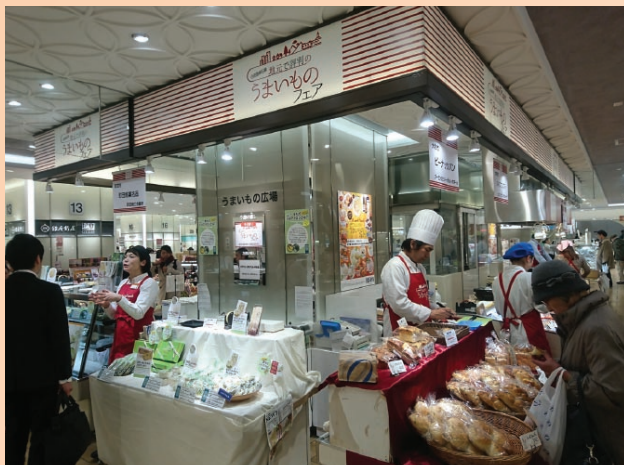
小田急百貨店町田店地下1階の会場の様子

して、昨秋には「食」のコーディネーターを交えた勉強会や小田急百貨店のバイヤーの助言により、百貨店等に出店する際に取り組むべき課題を抽出し、具体的な改善に取り組んできた。市内では新商品開発の支援として、11月に地域資源「まちだシルクメロン」を使用したピュールを無料で配布