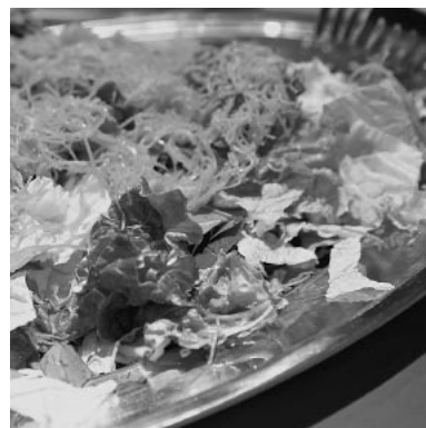
町田産農産物を使ったサラダが テーブルを彩る