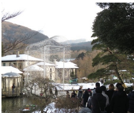
雪が残る箱根ガラスの森美術館を訪れたツアー参加者

カップル投票の結果、見事に5組のカップルが成立。成立したカップルには協議会からプレゼントを差し上げて幕を閉じた。