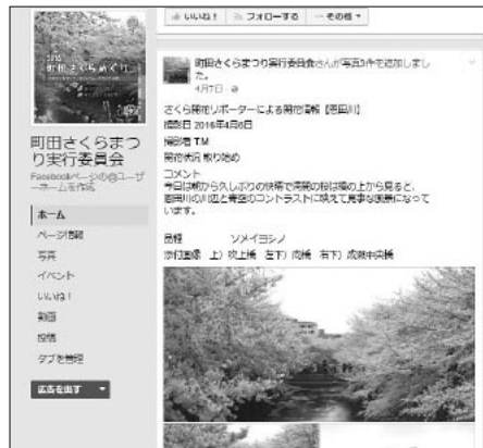
町田さくらまつり実行委員会のfacebookページでも市内の桜の開花状況やさくらまつりの情報などを紹介しています。