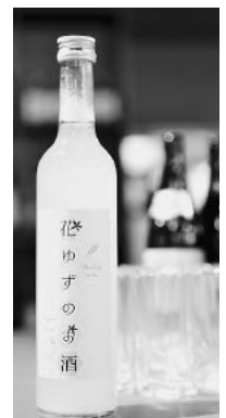
乾杯に使われた 「花ゆずのお酒」