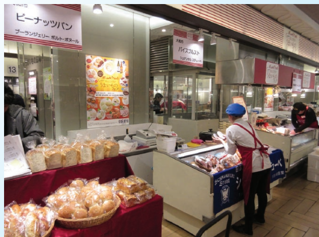
出店者が協力しあい、6日間にわたり開催した

本事業は他都道府県相互の産業振興を図る目的で東京都の地方連携事業を活用しており、今後2年間の継続を予定している。