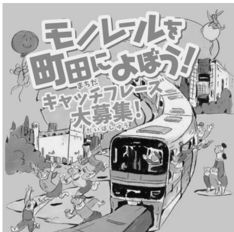
PRポスターの掲示にご協力いただける方も募集しています。

●内容・多摩都市モノレールが町田市を走るといふ未来を表現するものや、モノレールが町田まで延伸することを促進、応援するような表現の