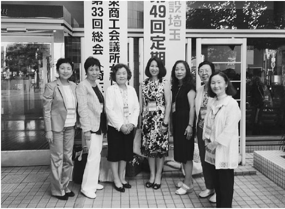
会場前にて記念撮影

最後に、今回の総会の開催地である小山商工会議所女性会から意気込みが語られ、盛会の内に終了した。