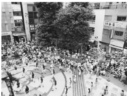
町田駅前でのイベントの様子

このプランに沿った町田市では、今年度から中小企業診断士、弁護士や税理士等の専門家を派遣事業