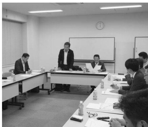
設立準備委員会の様子

なお、当所の定款へ「青年部」を明記するため、6月開催の通常議員総会に「定款の改正」が提案され、承認を得る運びとなっている。