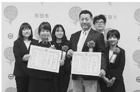
受賞企業の皆さん

町田市では、仕事と家庭の調和(ワーク・ライフ・バランス)の効果的な推進を目的として、従業員の仕事と家庭の両立を支援し、男女ともに働きやすい職場環境づくりを積極的に進める市内企業を表彰しています。