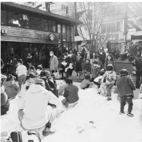
雪国の冬が体感できます

当協会と観光交流協定を結ぶ、長野県白馬山麓小谷（おたり）村から今年も新雪が届き、街の中に1日限りの雪