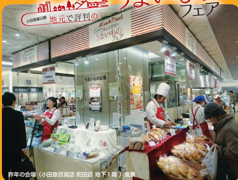
昨年の会場(小田急百貨店 町田店 地下1階)風景