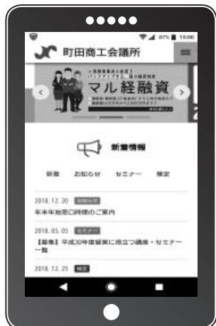
スマートフォン上での表示例