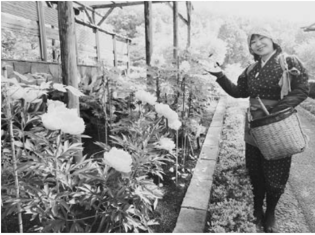
観光地を彩る花摘み

町田薬師池公園四季彩の杜では年間を通じてさまざまなイベントを開催しています。4月から5月にかけてはぼたん園での「ぼたんしやくやくまつり」、6月から7月にかけて薬師池での「しようぶ・あじさいまつり」を予定しています。期間中、園内で物品及