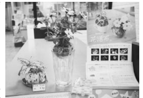
植物性培地を使用し、観賞後の焼却処分も簡単

花苗を使用するので切り花より日持ちがします。サレジオ高専はそのデザイン面に大きく関与していることから、当協会