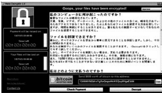
感染した場合に表示される画面の一例

世界150カ国、30万件以上の被害が確認され、英国では医療機関において業務に支障が出るなどの深刻な影響が発生している。日本でも大手製