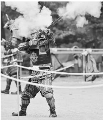
観光コンベンション協会賞 「構え！打て！」10BAN

10月28日に開催された「町田時代祭り2018」。当協会設立10周年を記念してフォトコンテストを初めて実施したところ、52作品の応募がありました。厳正な審査の結果、実行委員会賞、観光コンベンション協会賞、一般投票賞（ウェブ上で投票を行い、得票数の多かった作品）が決定しました。受賞作品は1月下旬まで、まちの案内所 町田ツーリストギヤラリーで展示します。力作をぜひご覧ください。