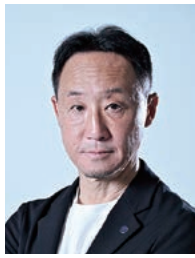
黒田剛 GO KURODA

昭和45年生まれ。大阪体育大学卒業後、一般企業等を経て青森山田高校サッカー部コーチとなり、平成7年に監督就任。全国高校サッカー選手権をはじめとする全国大会で計7回の優勝へ導く。令和5年にはFC町田ゼルビアの監督に抜擢され、わずか2年でJ2リーグ15位からJ1リーグ3位へ急成長させるミラクルを演出。令和7年の天皇杯も制した。