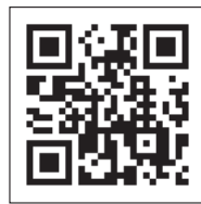
▲エルタックスホームページはこちら

詳細はエルタックスホームページ( https://www.eltax.jp/taojp/ )をご覧ください。