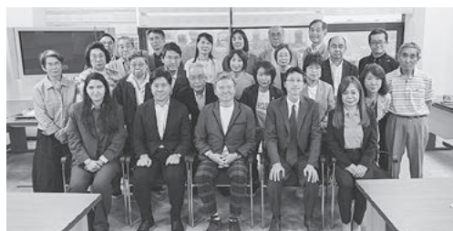
JICA、JETRO職員との記念撮影

今回の視察を通じ、急成長する中央アジアの活気と、親日国としての温かさに触れることができた。現地事情に精通した関係機関との意見交換や実地見学により、今後の海外展開や経済交流に向けた有意義な知見を得る機会となった。