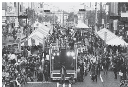
原町田大通りを埋め尽くす来場者

飲食以外にも、町田市トライアル発注認定商品のPRと販売が行われた他、当所工業部会のネジ締め体験をはじめ、家