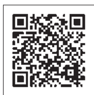
町田市内中小企業者向け支援制度ページ