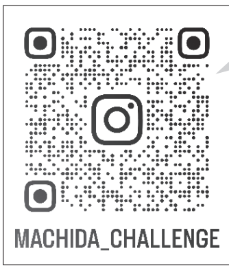
「チャレンジするならTOKYOの町田から!」 町田市公式Instagramアカウント