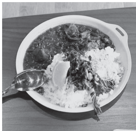
ブラジルの国民食「フェイジョアード」