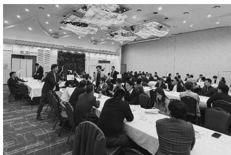
全体委員会の様子