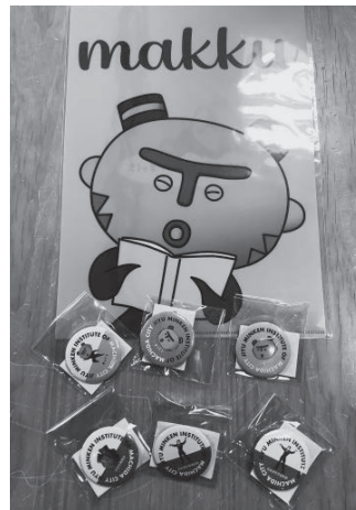
クリアファイル・缶バッジ各200円

まちの案内所 町田ツーリストギャラリーでは、まちだ縄文キャラクター「まっくう」公式グッズの販売を開始しました。「まっくう」は田端東遺跡(小山町)で発見された、町田市指定有形文化財「中空土偶頭部(ちゅうくうどぐうとうぶ)」をモデルに生まれました。思わず手に取りたくなるクリアファイルや缶バッジなど、日常で使えるアイテムを販売しています。人気キャラクター「まっくう」の公式グッズ、ぜひチェックしてください!