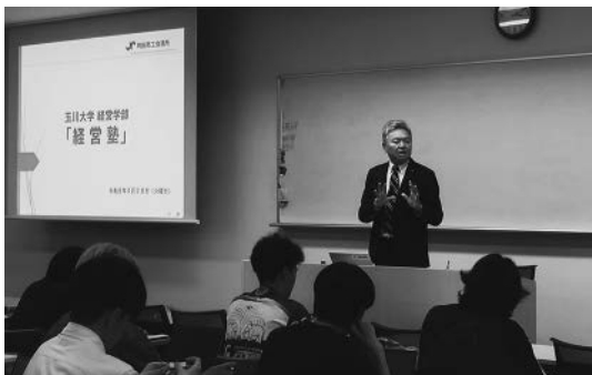
講義する澤井会頭

本プログラムでは、7月上旬までに計7人の講師が順次登壇し、熱意ある講義が継続される予定である。