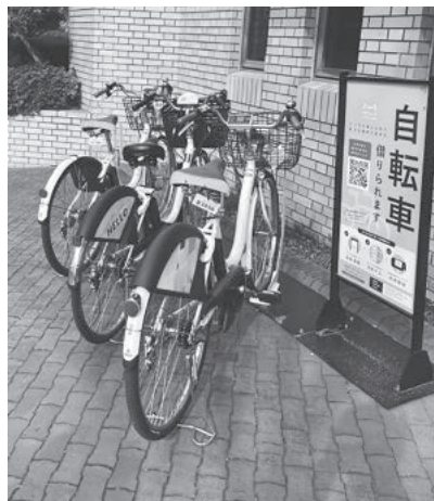
南市民センター シェアサイクルステーション