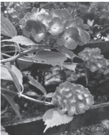
一緒に生田緑地でリフレッシュしませんか

ウム観覧代(一般320円) 詳細・お申込は「まちだふらっと」( https://machida-fat.com/ )を「確認」ください。