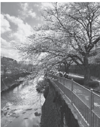
恩田川沿いの桜並木

一の桜鑑賞と鎌倉古道散策」を開催しました。青空に恵まれ、最高のウォーキング日和となりました。ぬぼこ山では、ガイドの方が丁寧に説明していただき、一輪挿しのお土産までいただきました。その後は、かしの木山・鞍掛の松・松村邸など、恩田川沿いの見どころをめぐり、話題の新施設ペスカドーラ町田クラブハウス内のカフェ「キボン!フェイジョアード・テラス」へ。昼食は黒インゲン豆と肉を煮込んだ伝統料理「フェイジョアード」をいただきました。さくらを眺めながらのひとときは、歩いたあとの心地よい休息となりました。