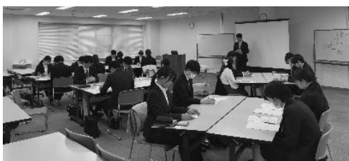
新入社員研修の様子