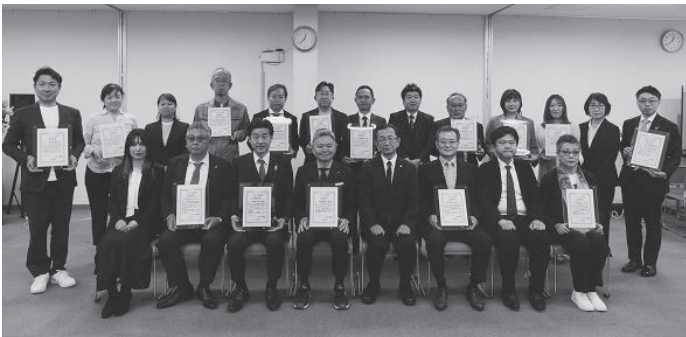
認定証を持つ参加者の皆様

経営の具体的な取り組みに ついて活発な情報交換が行われ、市内における今後の健康経営のさらなる推進と定着に向け、弾みをつける有意義な場となった。