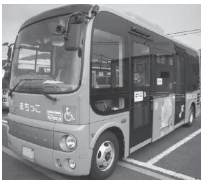
↑まちっこ 「相原ルート」