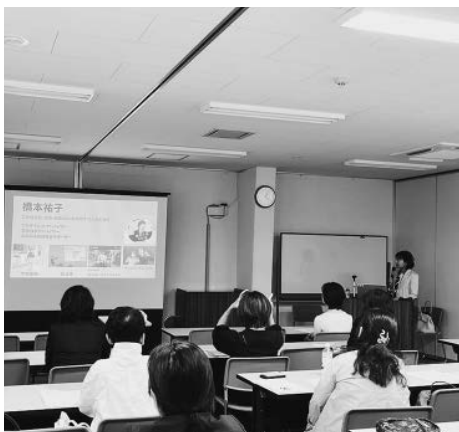
第二部 セミナーの様子

総会後は懇親会も開催され、会員同士の繋がりが生まれ情報交換も行われるなど、有意義な時間となった。