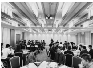
全体委員会の協議風景

今回も全6委員会に分かれて今期の具体的な事業計画策定に向けた熱心な議論を展開した。第一部の全体委員会には59名、第二部の懇親会には47名が参加し、新年度におけるメンバー間の交流を深めるとともに、組織の結束をさらに強める好機となった。