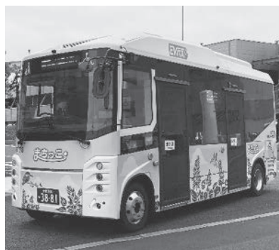
↑まちっこ 「公共施設巡回ルート」